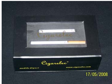
1/ Réception du Kit02