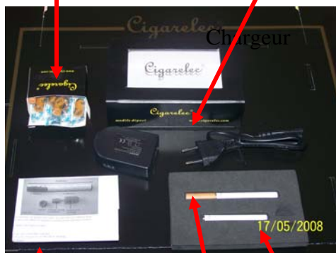
Boîte de 5 cartouches Chargeur