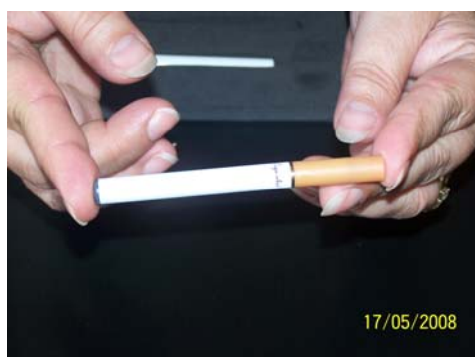
7/ Prendre la cigarette