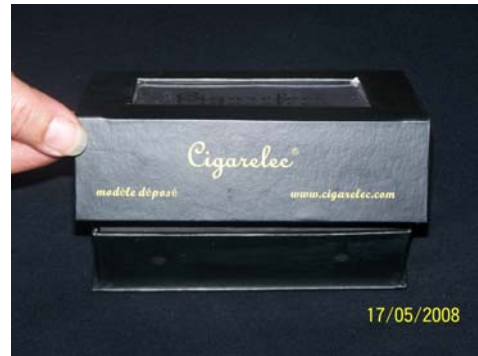
2/ Ouverture de la boîte