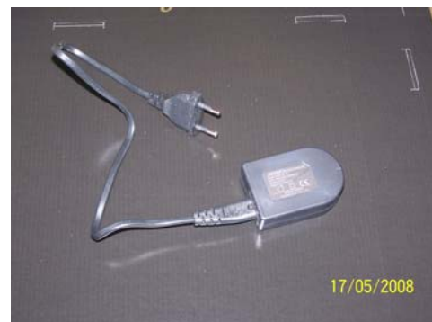
4/ Préparer le chargeur et le brancher sur secteur